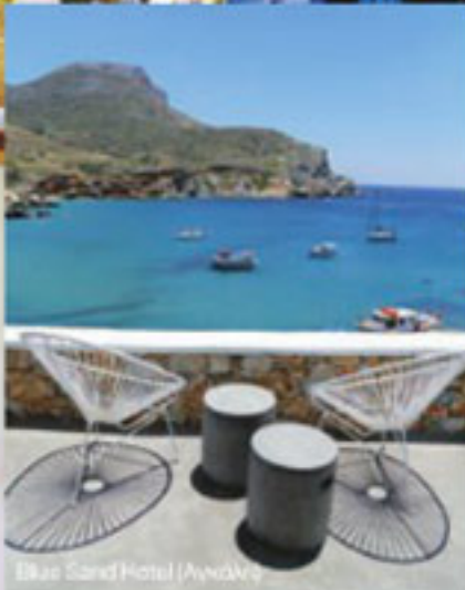
Blue Sand Hotel (Ανα Μερσί)