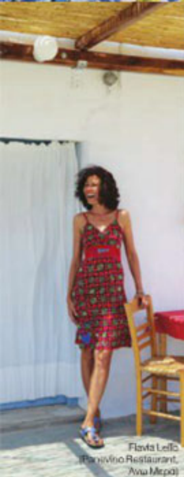
Flavia Lefka Panivino Restaurant, Ανα Μερσί