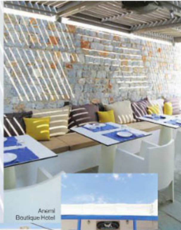
Anemi Boutique Hotel